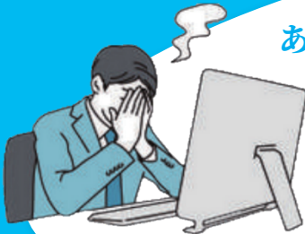
Parts Check Tool ©